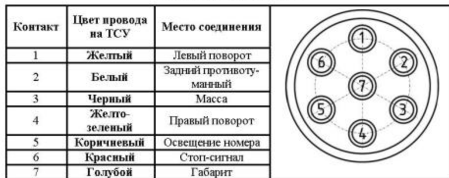
СХЕМА МОНТАЖА ТСУ