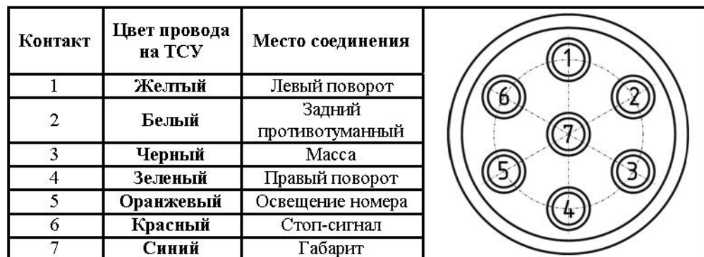
СХЕМА МОНТАЖА ТСУ